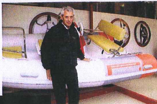
Sopra, Marco Tronchetti Provera durante la presentazione dei gommoni in occasione del Trofeo Pirelli a Santa Margherita Ligure.

Dopo più di 50 anni dall'esordio nella nautica, il gruppo italiano conia Pzero, una nuova linea di gommoni. Sono costruiti da Tecnorib.