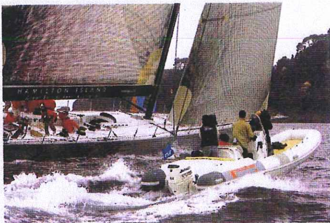
A sinistra, i gommoni presentati sono stati subito utilizzati come mezzi per la stampa durante le regate.

La nuova linea si sviluppa su 6 modelli: il 420 (omologato per una potenza massima di 75 cv/55), il 470 (cv 95), il 600 (150 cv), il 660 (190 cv) e il 770 che può